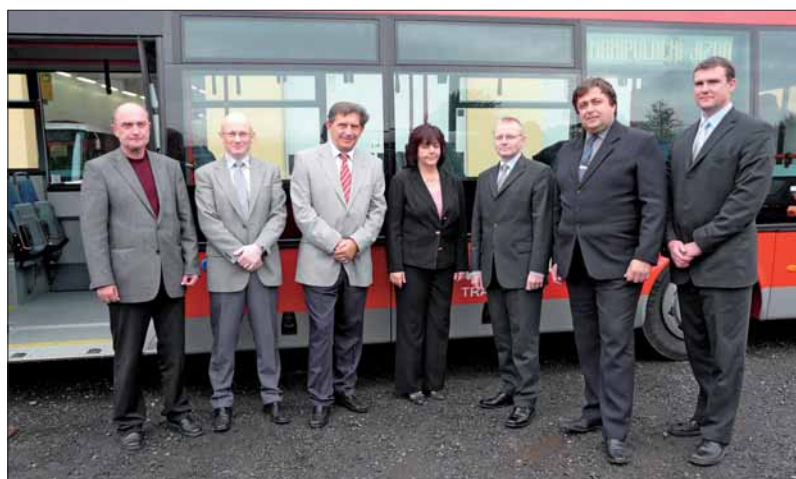
▲ Vedení Veolia Transport Východní Čechy a.s., společnosti SOR Libchavy a Pardubického kraje při předávání nového autobusu.