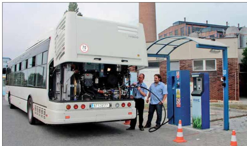
▲ Autobus IVECO Citelis CNG, zapůjčený k testování společností Tourbus, a.s., jsme zachytili při doplňování paliva na čerpací stanici v areálu brněnských plynáren.