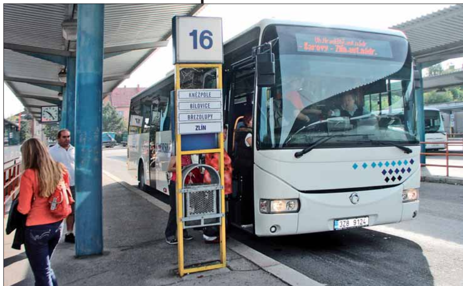
Jeden ze tří letos pořizovaných linkových autobusů CROSSWAY 12 m.

▲ Součástí tradičního servisního a prezentačního dne, pořádaného 7. října Střední školou automobilní v Holicích, byla i výstava vozidel. Podrobnější informace o této akci zaměřené mj. na bezpečnost silničního provozu přineseme v příštím čísle.