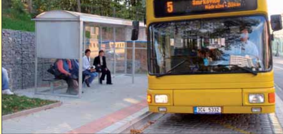
▲ Částečný pohled na novou autobusovou zastávku v Budějovické ulici v Písku.

na korán. Z této částky město Písek z vlastních prostředků uhradí 1,5 mil. Kč a 2 miliony korun budou hrazeny z dotace Regionálního operačního programu NUTS II Jihozápad. Podmínky stávající zastávky jsou s touto původní, která vlastně byla jen místem s označником, nesrovnatelné. Cestující si mohou užívat zastřešenou čekárnu s lavičkami. Zastávka bude sloužit MHD i linkovým spojům směr Vodňany, Týn nad Vltavou, Temelín a České Budějovice. Do „zářív“ nástupiště se vejdou dva dlouhé klubové autobusy za sebou. Pro dosažení maximální bezbariérovosti je okraj nástupiště osazen speciálními obrubníky, takže řidiči mohou autobus přistavit těsně k chodníku, aniž by riskovali poškozením pneumatik. Bezpečnost chodců jistí nejen nový chodník protažený ke křižovatce s ulicí U Obory, ale i nový přechod přes vozovku. M. PETRŮ