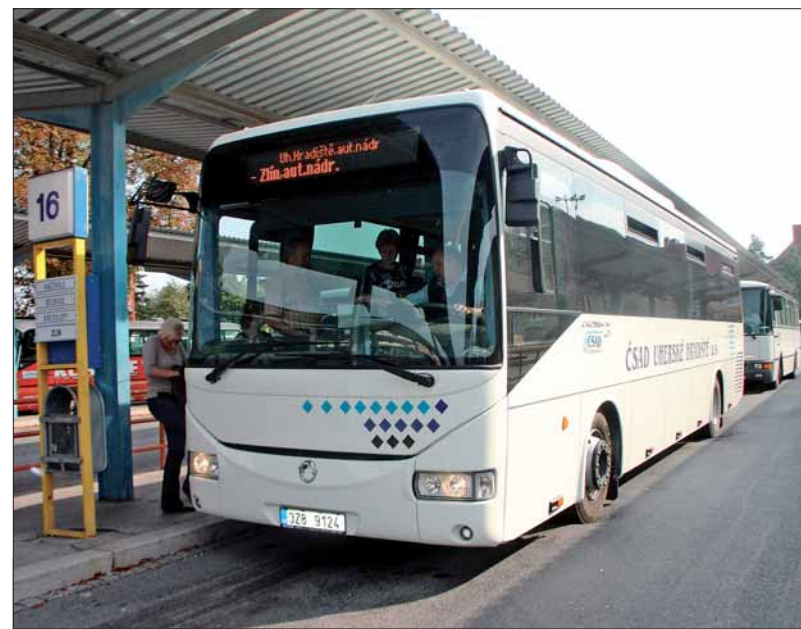
▲ Linkový autobus Irisbus CROSSWAY 12 m před odjezdem z autobusového nádraží v Uherském Hradišti.

zajištění lepší tepelné pohody cestujících mají autobusy také zdvojená skla. Také tyto vozy nasazujeme postupně do provozu ve druhém pololetí letošního roku.