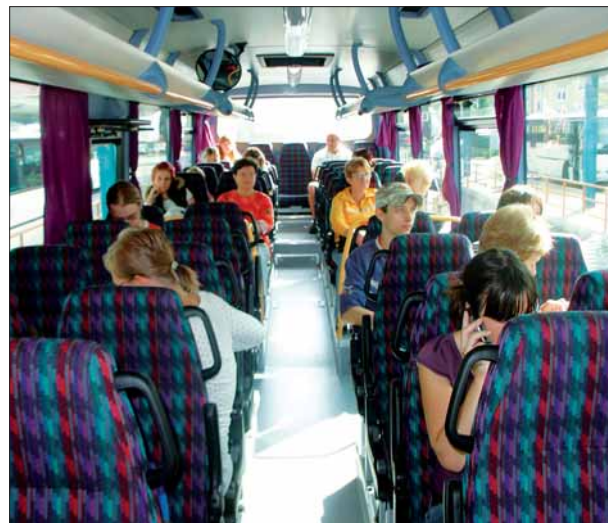
▲ Autobusy CROSSWAY mají nadstandardní výbavu – zvýšená sedadla a klimatizaci.

„Tři z letos pořizovaných autobusů jsou v nízkopodlažním provedení